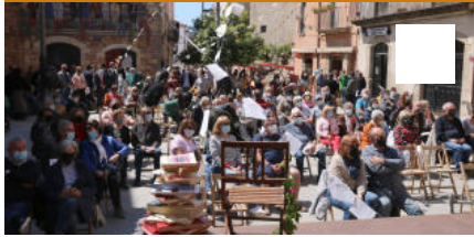
Diada de Sant Jordi, a Colonge