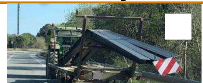
Denunciat el xofer d'un tractor per transportar bigues de ferro amb un remolc a Siurana