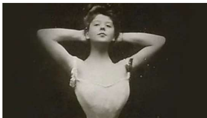
[Fotos] Así es la evolución del canon de belleza femenino desde 1910 Patrocinado por Articlestone