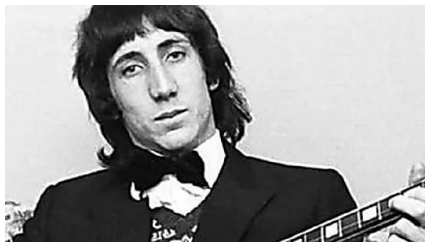
[Fotos] El compositor más rico de todos los tiempos no es quien pensabas Patrocinado por Worldemand