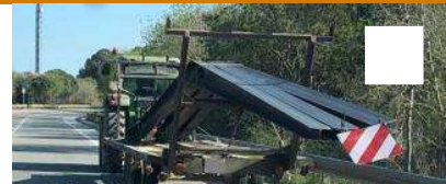
Denunciat el xofer d'un tractor per transportar bigues de ferro amb un remolc a Siurana