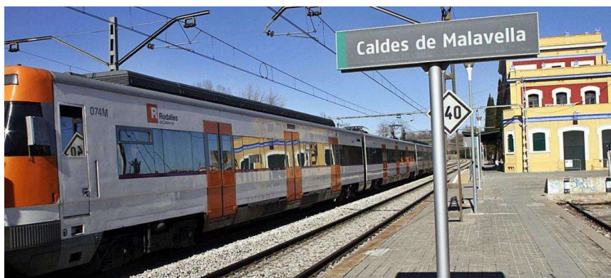
L'estació de trens de Caldes de Malavella, en una imatge d'arxiu. diari de girona

Ddg., Caldes De Malavella | 29.03.2021 | 23:12