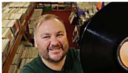
[Fotos] Si tienes alguno de estos discos de vinilo antiguos, acabas de hacer una fortuna Patrocinado por Novelodge