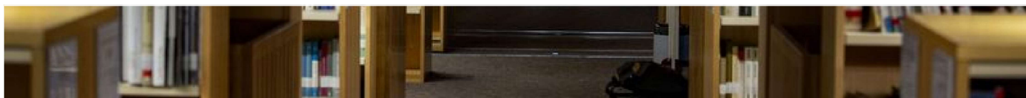
Una biblioteca en una imatge d'arxiu.

BARCELONA A partir d'avui qualsevol persona d'arreu de Catalunya pot demanar en préstec llibres de totes les biblioteques del país. La Generalitat i la Diputació de Barcelona han integrat els catàlegs bibliotecaris perquè tot el territori compti amb un mateix catàleg compartit i, per tant, el carnet de qualsevol biblioteca catalana serveixi per a tot el país. Fins ara els catàlegs bibliotecaris estaven dividits en dos: d'una banda hi havia l'Aladí, el de la Xarxa de Biblioteques de la Diputació de Barcelona i, de l'altra, hi havia l'Argus, el catàleg de la Generalitat, que integrava les biblioteques de Girona, Lleida, Tarragona i les terres de Lleida. Ara les dues institucions han unificat els catàlegs en un de nou, anomenat Atena, i que permetrà als usuaris agafar en préstec documents de tots els equipaments catalans.