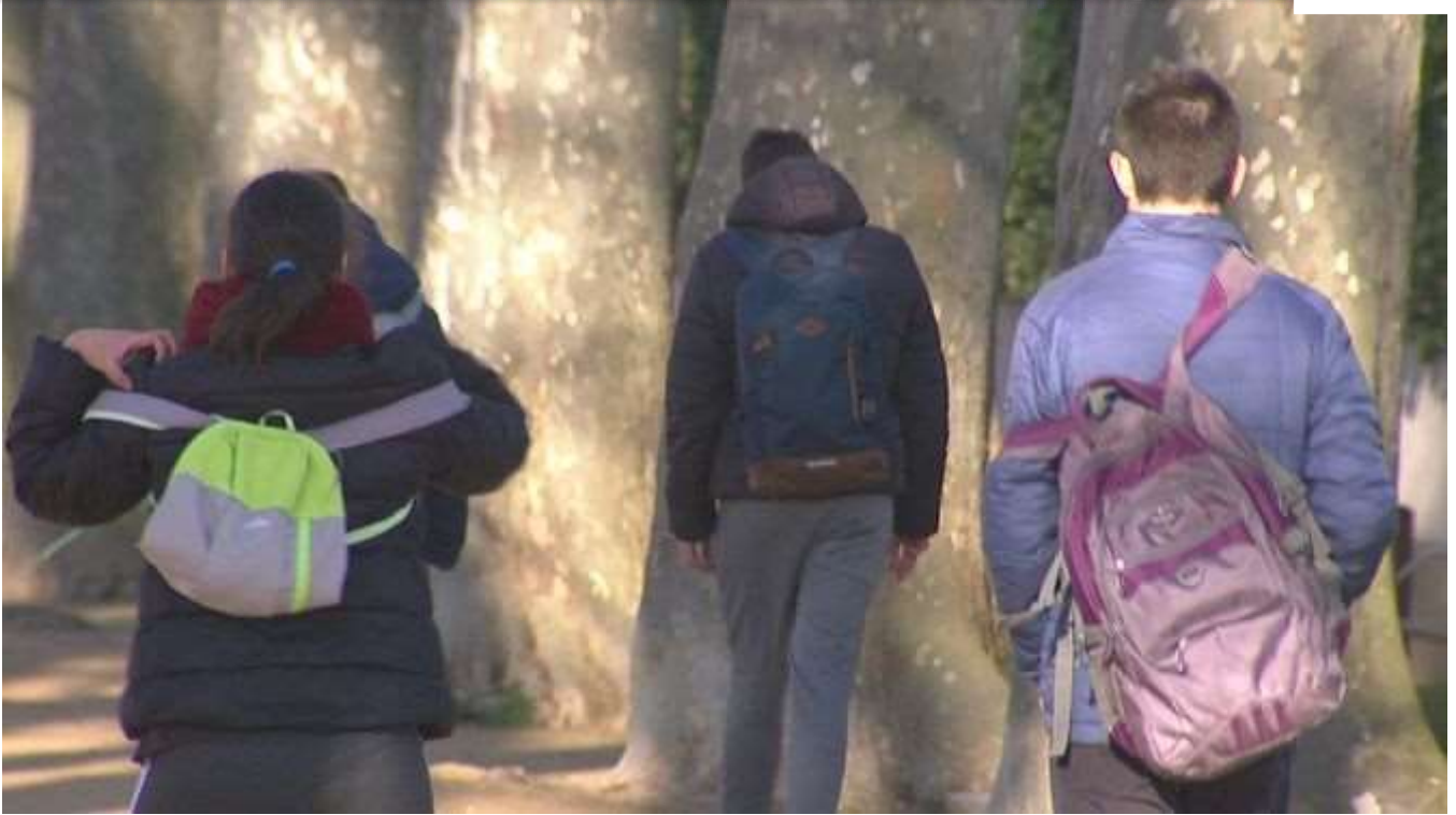
Alumnes de Mare de Déu de Montserrat de Caldes de Malavella

La motxilla que porten, per exemple, els dona el que els fa falta: informació i, sobretot, seguretat . Portar-la a sobre els diu que ara és l'hora d'anar a fer un volt.