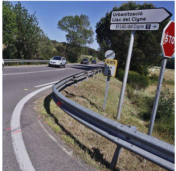
La carretera de Caldes, la GI-673, una de les de risc.

Per cinquè any consecutiu, el tram que acumula més accidentalitat greu de Catalunya (sense tenir en compte el trànsit que hi passa) es troba a la C-58 entre Barcelona i Cerdanyola. La majoria dels trams