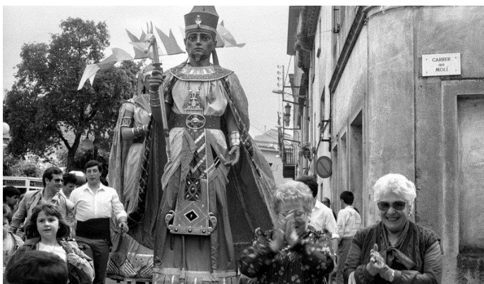
Cercavila de gegants i capgrossos de Cassà de la Selva durant la festa major del 1988 JOAN CARLES CODOLÀ.