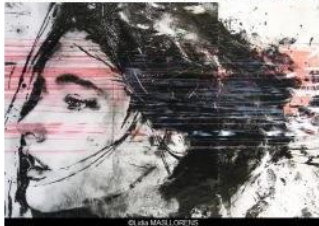
© Lidia MASLLORENS & Galerie ARCTURUS

Date Du 02/10/2018 à 14h00 au 03/11/2018 Vernissage le 02/10/2018 à 19h00