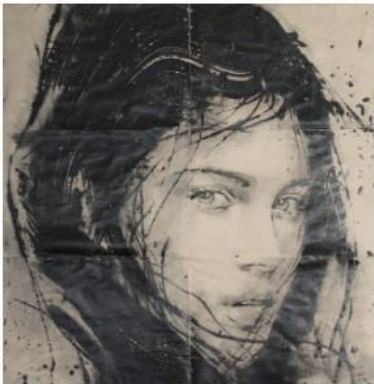
Lidia Masllorens Untitled, 2018, 2018 Galerie Arcturus