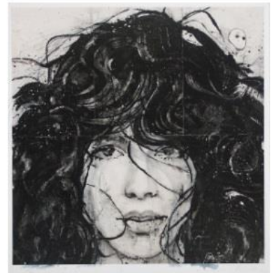
Lidia Masllorens Litho n°9, 2017 Galerie Arcturus