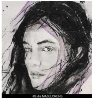
© Lidia MASLLORENS & Galerie ARCTURUS