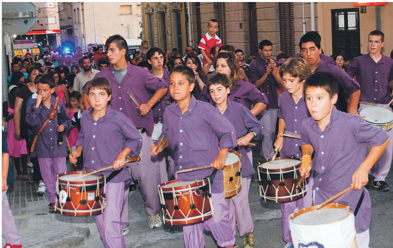
Les notes dels timbals i les gralles ompliran de música els carrers de Caldes de Malavella durant la festa major que arrenca demà