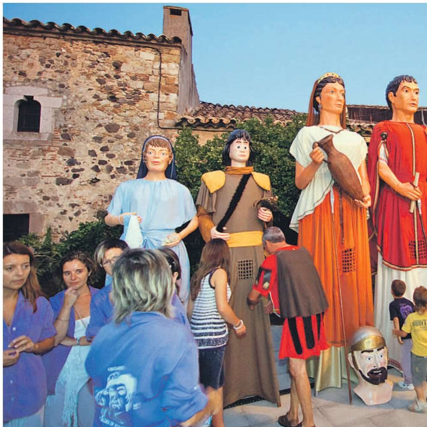
Cercavila. La Colla Gegantera de Caldes de Malavella protagonitzarà la cercavila el dia 31