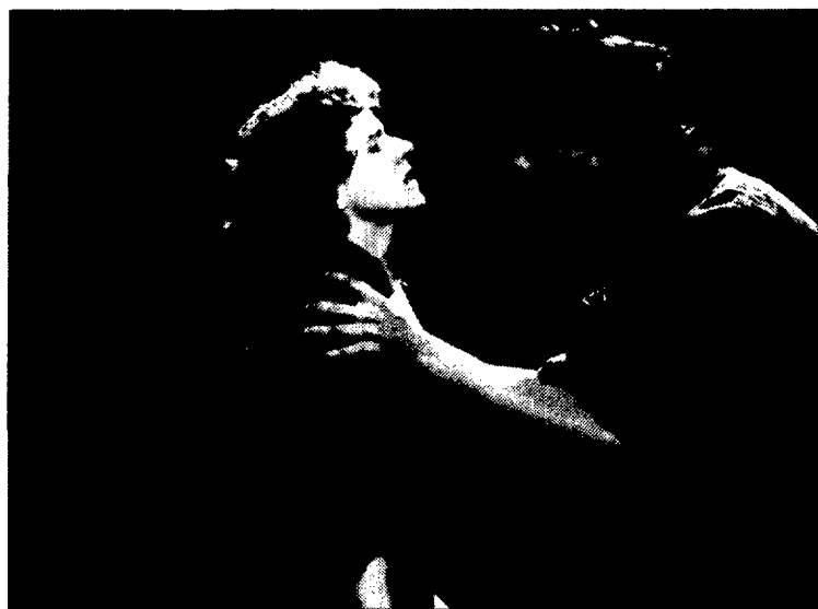
El Rusc representa «Amb la ràbia al cos» des de fa un any i mig.