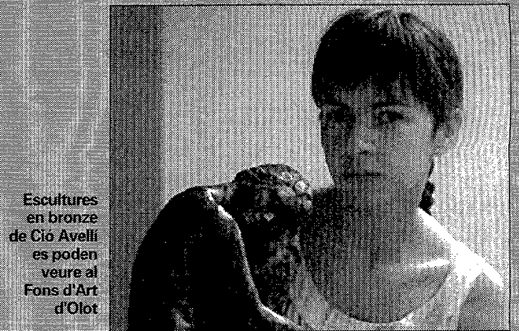
Escultures en bronze de Cio Avelli es poden veure al Fons d'Art d'Olot