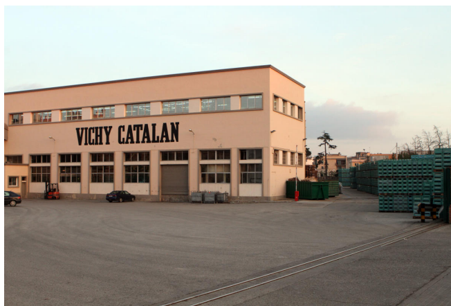
Vichy Catalan es bolca en la venda «online» per compensar els efectes de la crisi en l'hostaleria

Vichy Catalan està acabant aquest 2020 intentant equilibrar una balança que la crisi de la covid-19 ha descompensat. Per un costat hi ha l'hostaleria, sector que ocupa una part important del negoci de la companyia comercialitzadora d'aigua mineral. La pandèmia ha abocat els bars i restaurants a una situació crítica i l'empresa reconeix que això els ha passat factura.