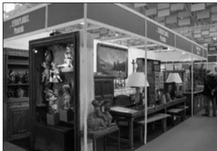
Un dels estands de la Fira, l'any passat.

De manera estratègica, la Fira d'enguany treballa per presentar la millor oferta de peces d'interès i qualitat indubtable; una selecta i variada mostra (mobiliari, pintures, escultures i arts decoratives) procedent dels millors antiquaris i brocanters de l'Empordà. I si els visitants que van gaudir de la darrera edició de la Fira (més de 10.000) van poder contemplar llavors al vol-