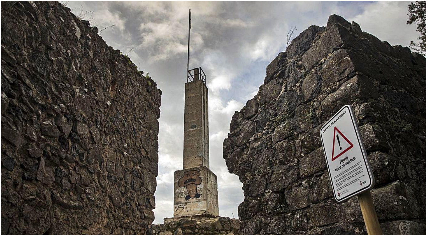
L'estructura que l'Ajuntament enderrocarà.