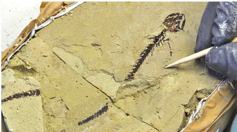
Troben restes de tritons i tortugues al jaciment del Camp dels Ninots