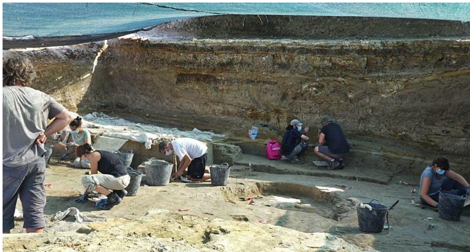
Els treballs a l'excavació anual al jaciment de Caldes de Malavella

La campanya anual d'excavacions al Camp dels Ninots de Caldes de Malavella ja està a ple rendiment, adaptada, això sí, a la pandèmia. La divuitena campanya al jaciment pliocè, que ha arrencat aquesta setmanam ha decidit reduir el nombre de participants i ampliar la superfície d'excavació per poder garantir les mesures sanitàries.