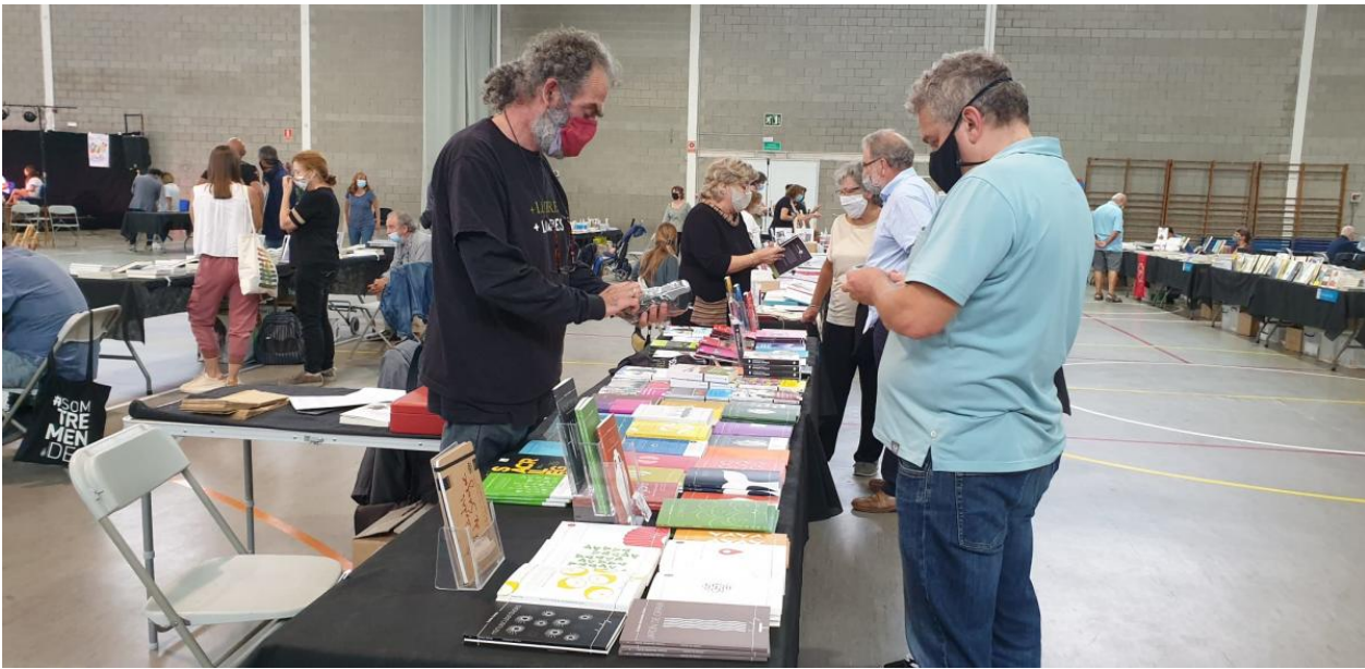
La tercera edició de l'Indilletres omple de cultura la Bisbal