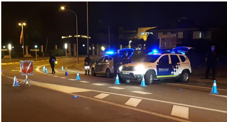
Control de la Policia Local de Caldes de Malavella

Clàudia Sacrest Martos | 15.07.2020 | 00:25