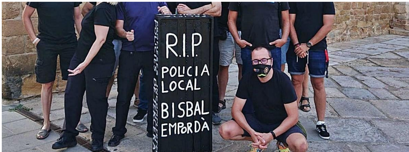
Els agents abans de pujar al ple per fer-hi la protesta

Els efectius de la Policia Local de la Bisbal d'Empordà van protagonitzar dimarts al vespre una «marxa fúnebre» al ple de l'Ajuntament. Van pujar a la sala de plens tots vestits de negre i amb un taüt casolà. A la caixa s'hi podien llegir queixes i proclames. Entre aquestes hi havia «policia low cost », «promeses incomplertes» o «agents sense autoritat».