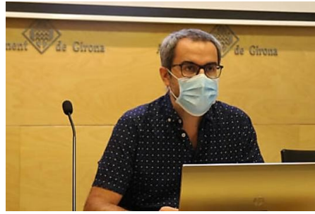
JxCAT ha de retirar un punt sobre neteja de l'ordre del dia del ple municipal de Girona per manca de...