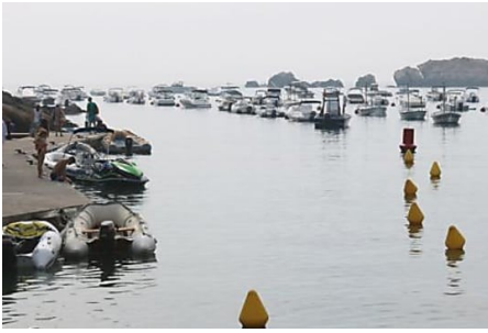
Mor una nena de 8 anys a Begur atropellada per una embarcació