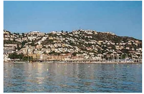
Uns turistes donen positiu a Roses i obliguen a tancar un restaurant i a confinar treballadors d'un hotel