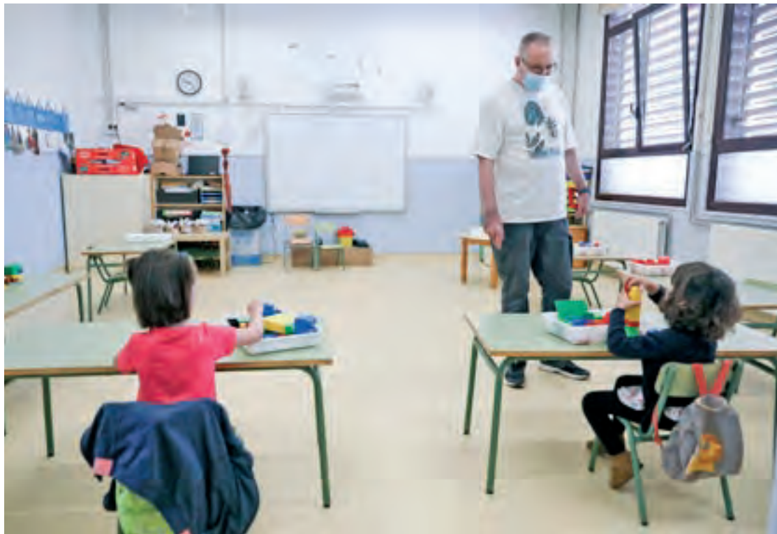
Dues alumnes en una de les aules d'Educació Infantil, aquest dimarts a l'escola Fortià Solà de Torelló

On l'assistència és més alta ha estat en cursos de finals d'etapa, d'entre el 50% i el 60%, a 6è o 4t d'ESO. En aquest cas, apunta Collell, fins a final de curs pot aug-