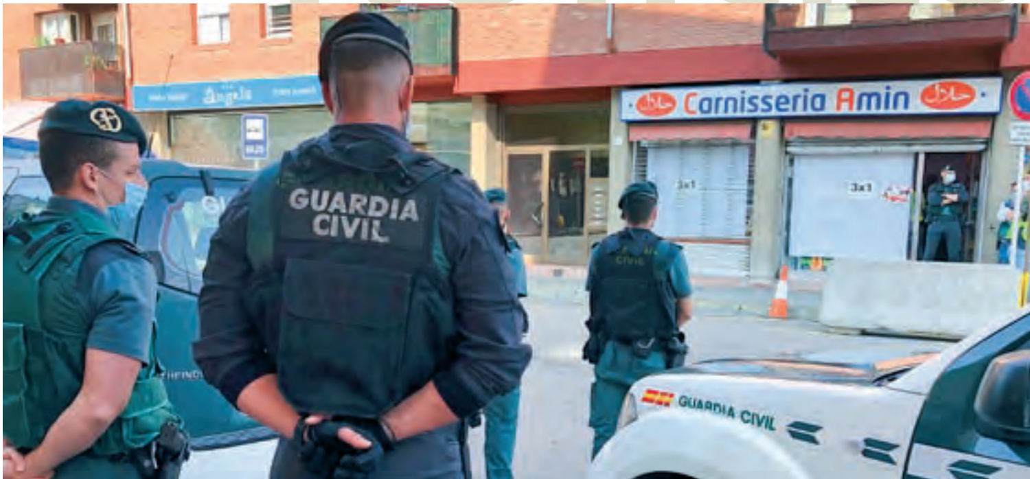
L'operatiu de dimecres estava format per prop d'una vintena d'agents de la Guàrdia Civil i es va centrar en un establiment del carrer Pare Huix