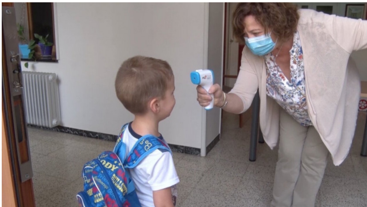
Es pren la temperatura a tots els alumnes abans d'entrar al centre