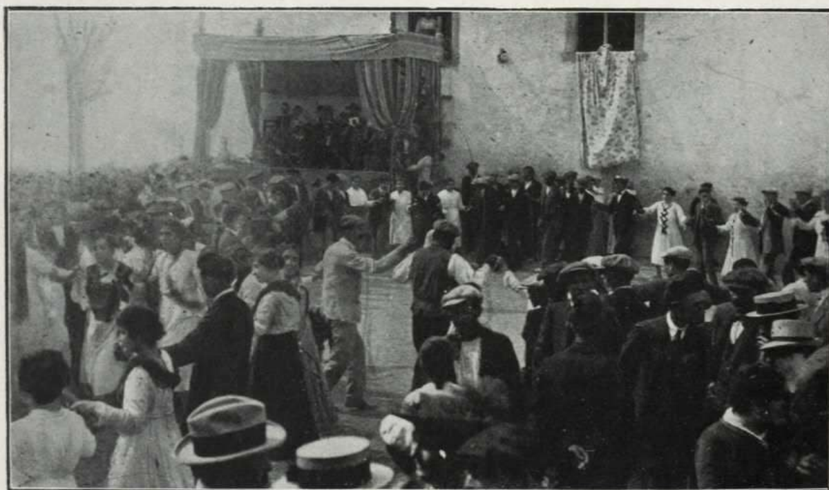
LO POBLE DE CALDES DE MALAVELLA BALLANT SARDANES A LA PLAÇA'L DIA DEL HOMENATGE AL SENYOR PLA Y DENIEL. — (Eonet f)