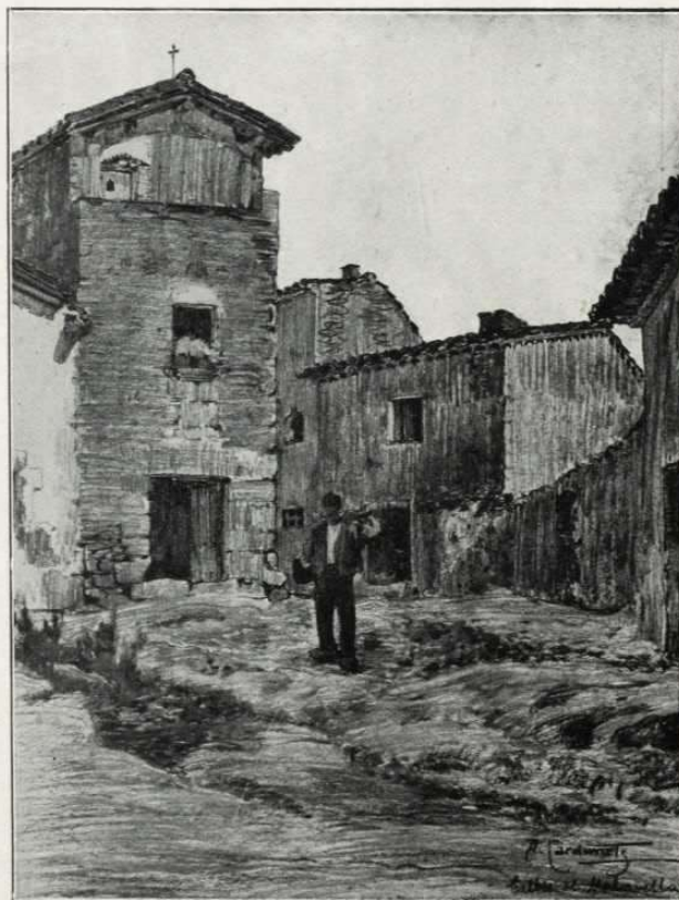
UNA PLACETA DE LA PART VELLA. — (Dibuxos de A. Cardunets)