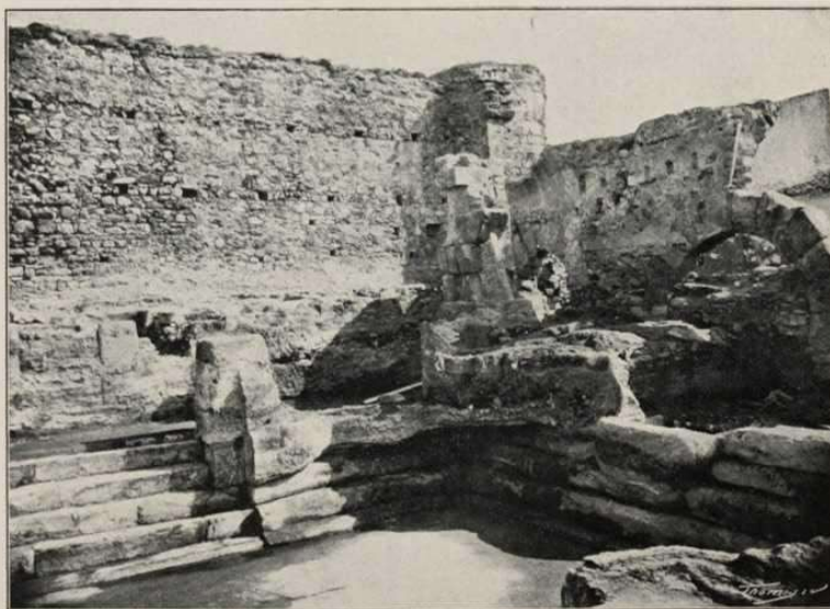
L'ÀNGUL SUPERIOR (DRETA) QUE S'HA DEXAT, TAL COM S'HA TROBAT, COBERT PER UNA GRUXA DE SALS

Se tracta efectivament de la piscina de les termes romanes allí existents; te la forma d'un rectàngul de 9'60 m. de llarch per 9'60 m. d'ample en sa part alta, y de 8'15 m. de llarch per 6'60 m. d'ample en son fons, per motiu dels 5 grahons que la rodejan solsament per ses parts laterals y anterior, considerant com a tal la que conté la obertura per hont hi anava l'aygua; la part posterior no presenta cap grahó y sí solsament una mitja canya ab que terminan els grahons laterals. Està casi exactament orientada d'Est a Oest. En sos 4 ànguls se conservan els basaments d'altres tantes columnes, y entre ells els d'altres també quadrades, y per detalls que restan se veu qu'entre unes y altres hi havían archs que tancavan tot aquell recinte quadrangular. Tot al seu voltant hi havia un corredor de 2 metres d'amplada cobert també per volta, y des-