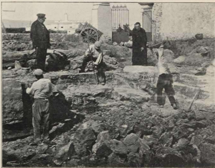
DESCOBRINT L'ÀNGUL INFERIOR (ESQUERRA) A BARRINADES Y A COPS DE MALL Y D'ESCARPRA