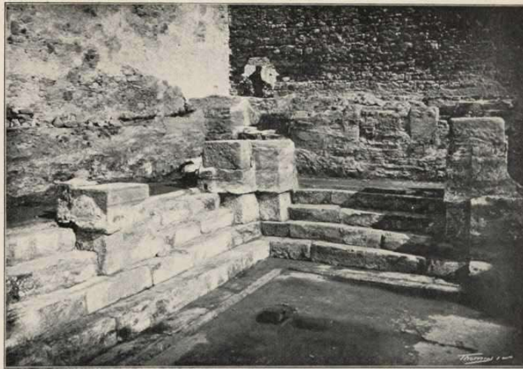
L'ANGUL SUPERIOR (ESQUERRA)

AB EL PASSADÍS ENTRE LA PISCINA GRAN Y LES PETITES