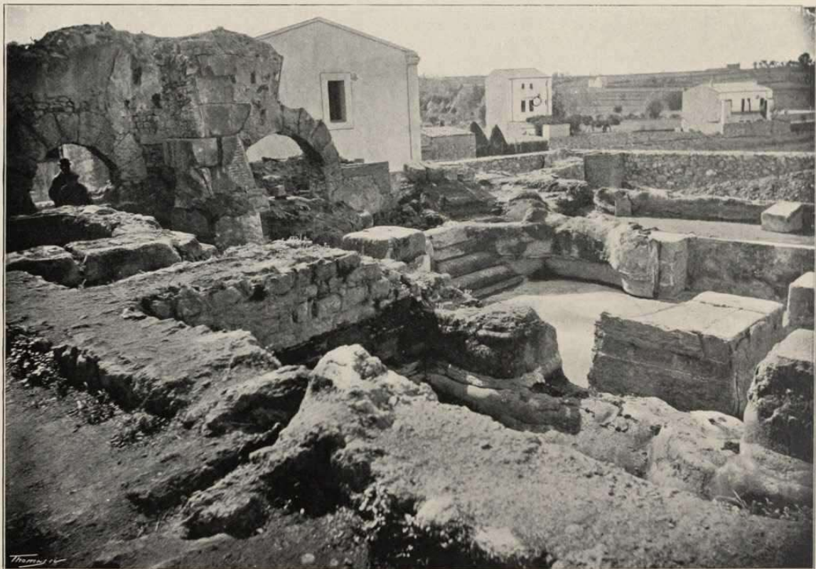
VISTA GENERAL DE LES PISCINES Y ARCHS DE COMUNICACIÓ AB ALTRES DEPENDÈNCIES

AB EL PASSADÍS ENTRE LA PISCINA GRAN Y LES PETITES