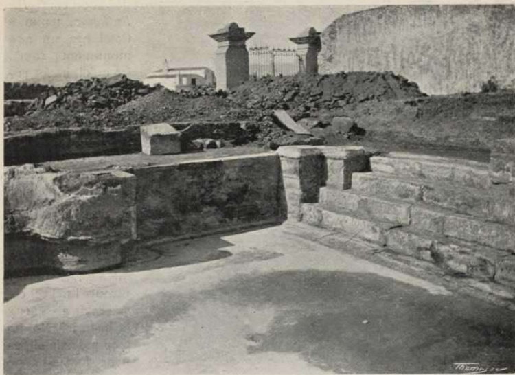
LO MATEIX ÀNGUL INFERIOR DESPRÉS DE DESCOBERT Y NETEJAT DE LES SALS QUE TENIA ADHERIDES

Pati del Hospital s'hi trobarian indubtablement altres restes en perfecte estat de conservació, y ab semblant idea adquirí aquest darrer lloch, y sense perdonar gasto feu comensar les obres d'exploració.