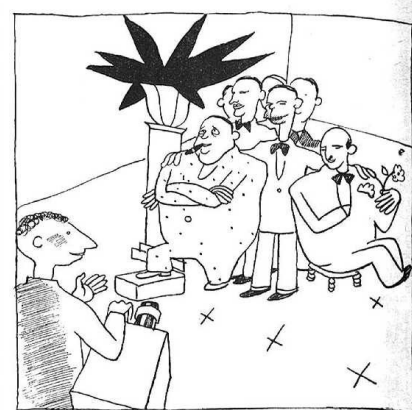
El fotògraf: — Farem un grupet! Lluhi: — Voleu dir que no arribem a grup?

Per a tractar amb anglesos... d'Anglaterra, res millor que estudiar l'anglès amb professors nadius, per CINQ pessetes el mes i sols 10 alumnes per classe. INSTITUT LEBRUN. Tallers, 27