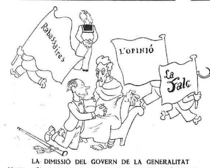
LA DIMISSIÓ DEL GOVERN DE LA GENERALITAT Macià. — Si es pensen que només en saben ells de fer trucs!