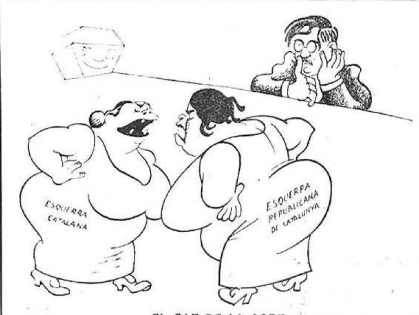
EL GAT DE LA SORT Rovira i Virgili: — Arribar-hi jo i començar el carro a anar pel dreger, ho estal tot u!

— I bé... les baralles no poden durar tota la vida; com que fet i fet també ens les hem de quedar, més val tractar amb ells que amb persones desconeixudes. Si ens avenim fins i tot els fem una rebuixa per fi de temporada.