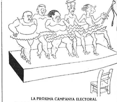
LA PROXIMA CAMPANYA ELECTORAL — Si ni així no engresquem, ni mai!