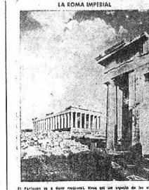
LA ROMA IMPERIAL

"La Humanitat" de diumenge publica la següent fotografia, amb els corresponents títols i epígrafs: