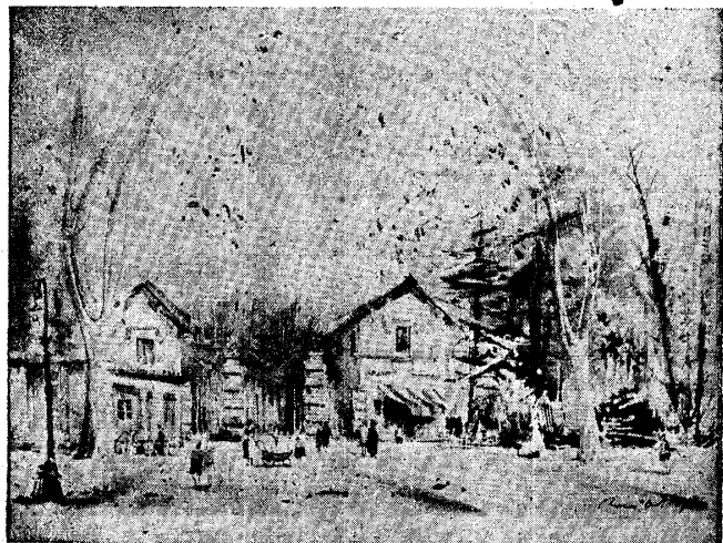
Original acuarela del maestro Roca Delpech, que se exhibirá este año, fuera concurso, en la Exposición de la Biblioteca Pública

La Diputación provincial avanza en un ambicioso programa cultural que tiende a elevar esos valores del espíritu que tanto aureolan el cotidiano vivir.