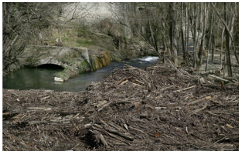
Les restes de troncs, canyes i branquillons s'acumulen a la Farga de Bebió al límit entre el Ripollès i l'Osona. Manel Lladó