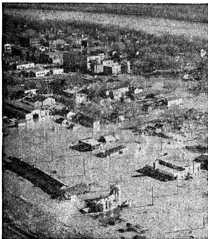
De nuevo, los caudalosos ríos norteamericanos, inundan extensas partes del país, poniendo en peligro los hogares de millares de personas y causando grandes pérdidas materiales. En la foto, un aspecto de las últimas inundaciones, en los Estados Unidos