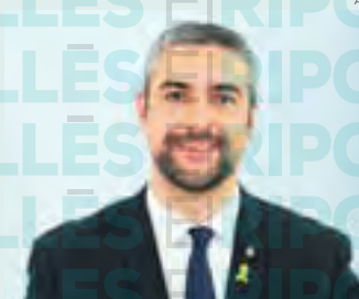
Bernat Solé, conseller d'Acció Exterior