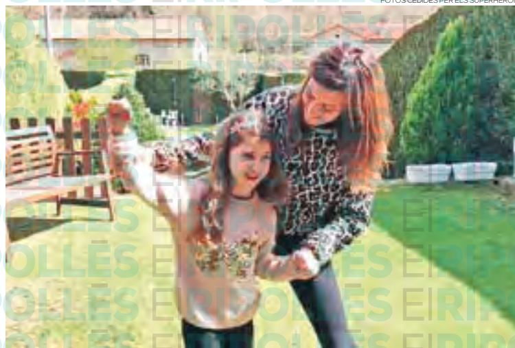
La música de ls Superherois es va fer sentir per les cases, també, gràcies a Ràdio Ripoll

A vegades falten idees per passar tantes hores a casa, complint amb el confinament. A més, si a la llar hi ha infants, encara cal espremer més la inventiva per trobar i realitzar activitats per trencar amb la rutina d'uns dies sense escola ni extraescolars. Dissabte passat, nens i nenes del Ripollès no van dubtar en participar d'una proposta ben especial, als balcons de les seves respectives cases. La iniciativa d'un grup de mestres i pares (amb el suport d'altres entitats i institucions de la comarca, com ajun-