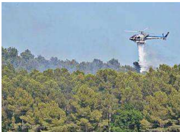
Un helicòpter efectuant tasques d'extinció a Garrigoles. joan manel zamora

La ràpida actuació dels bombers va fer que a penes es cremessin uns pocs centenars de metres quadrats