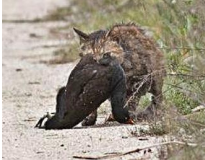
Els gats amenacen la fauna dels Aiguamolls.

«Si es veu un gat per l'espai natural», diu Romero, «no és que estigui passejant, l'animal estarà de cacera ». A la imatge de la dreta es pot veure un gat captat als Aiguamolls portant una polla d'aigua de força mida a la boca.