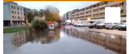
Veïns d'un carrer de la Bisbal, indignats per l'enèsima inundació