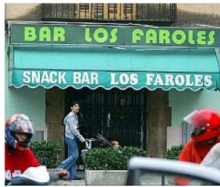
Piedra va ser estrangulat amb una cinta de persiana dins el local.