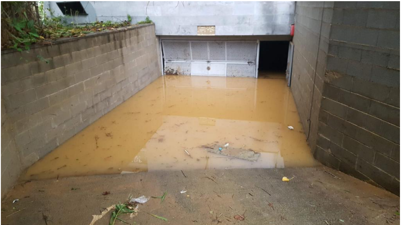
Entrada d'un aparcament de la zona completament inundat per les pluges de fa uns mesos

Ara bé, l'equip municipal no sempre ha estat de braços plegats. Pel que explica Fanals i altres veïns a la xarxa social, just abans de les eleccions van patir aiguats i l'alcalde els va atendre i va anar a veure els danys causats. «Quan van venir a veure el desperfecte de la riuada de l'any passat van dir que netejarien la riera i la condicionarien perquè no tornés a passar més», exposa l'usuari @Anthraxnet en el seu tuit. «Però ja no som a època d'eleccions i ja les promeses han volat», lamenta. L'Ajuntament ja ha assegurat a aquest diari que dilluns donarà explicacions.