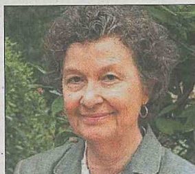
►► Maria Barbal.