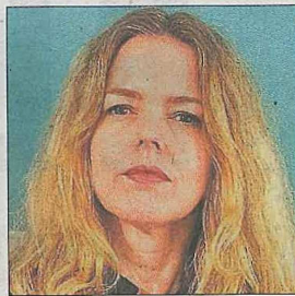
►► Christina Rosenvinge.