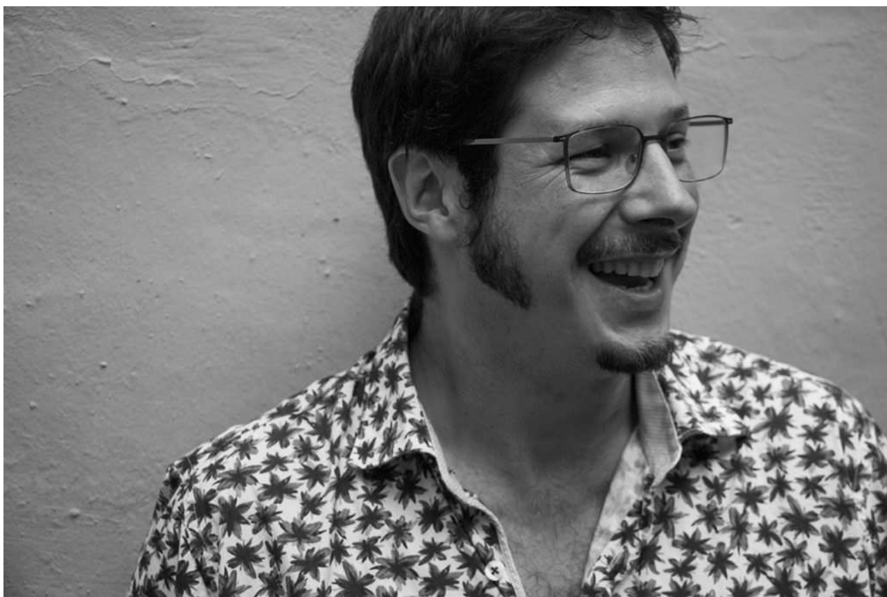
El poeta Josep Pedrals.

concerts i visites guiades. El festival està organitzat des de la Biblioteca Ferrer i Guàrdia i l'oficina de Turisme de Caldes.