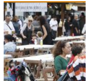
Festa de la cervesa de Platja