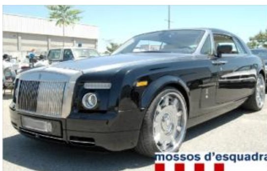
El Rolls Royce està ara a l'espera que se celebri el judici al conductor, imputat per falsedat documental. diari de girona

Els Mossos d'Esquadra han denunciat finalment el conductor d'un Rolls Royce que fa uns dies circulava per la Bisbal sense cap documentació que acredités de qui era el cotxe, que té matrícula neozelandesa. Els agents de Trànsit el van detectar perquè el trànsit del vehicle no era precisament distret: anava escortat per dues motos i un helicòpter. Els agents van esclarir que tots els implicats estaven filmant unes imatges publicitàries per promocionar, a través d'Internet, la cursa de vehicles de luxe Gumball 3000, que ha passat per Barcelona. El conductor denunciat té sis cotxes d'alta gamma més que, en aquest cas, sí que tenen papers. Precisament, el mateix dia en què es decidia multar el conductor del Rolls per falsedat documental, Trànsit efectuava un control en carreteres de Girona en ocasió del pas de la cursa. El resultat van ser cinc cotxes de gamma alta denunciats administrativament, trse denúncies per conducció temerària, una per conducció negligent i un per circular sense moderar la velocitat. Els integrants de la comitiva bisbalenca no escatimaven en tecnologia i tots els vehicles anaven