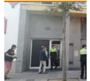
Tiroteig a Figueres