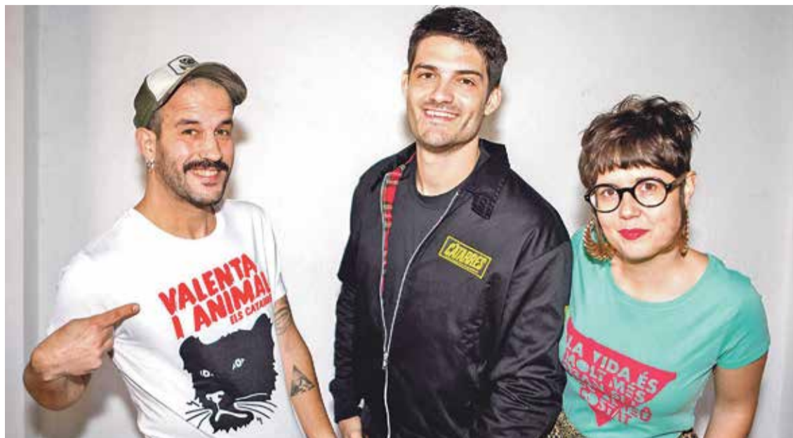
Els concerts es faran al passeig Marítim d'Empuriabrava a les 22.30 h

ELS CATARRS. Els d'Aiguafreda presentaran el seu últim treball, que porta per títol Tots els meus principis . Després de la gira del disc Big Bang el 2015, la banda va decidir aturar el seu camí uns mesos -gairebé tres anys- fins a l'estrena del seu nou disc, el quart en