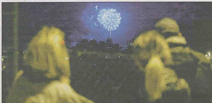
Les Festes es clouran el diumenge 5 de maig amb l'esperat piromusical ■ QUIM PUIG

L'esperada jornada del 2x1 del parc d'atraccions d'ahir va encetar la llarga programació de les Fires i Festes de la Santa Creu de Figueres 2019, que fins al 5 de maig proposen més de dues-centes activitats per a tots els públics. "Volem que aquestes festes siguin un reflex dels valors de la ciutat: de transversalitat, tradició i modernitat. Unes Fires que hem volgut que tothom se senti seves, amb activitats per a tots els públics i totes les edats, amb moltes novetats, però també reforçant i millorant les activitats d'èxit que es consoliden any rere any", exposa l'alcaldede local, Jordi Masquell.