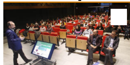
Cicle de reflexions sobre la vida i la mort