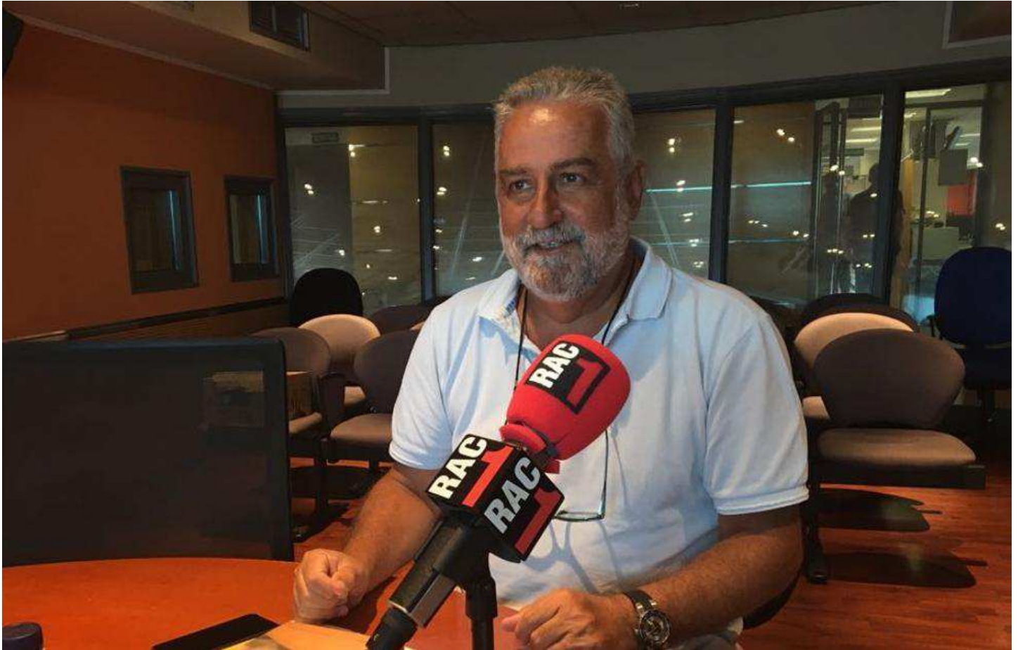
L'escriptor Rafel Nadal, als estudis de RAC1.