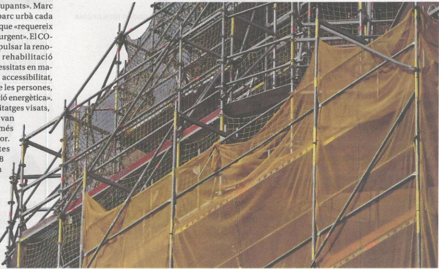
→ SUPERFÍCIE VISADA. PROJECTE EXECUTIU

En l'àmbit general de comarques gironines el preu mitjà de l'habitatge nou va augmentar l'any passat un 10% i és de 383.630 euros de mitjana (2.828 €/m 2 ). ■