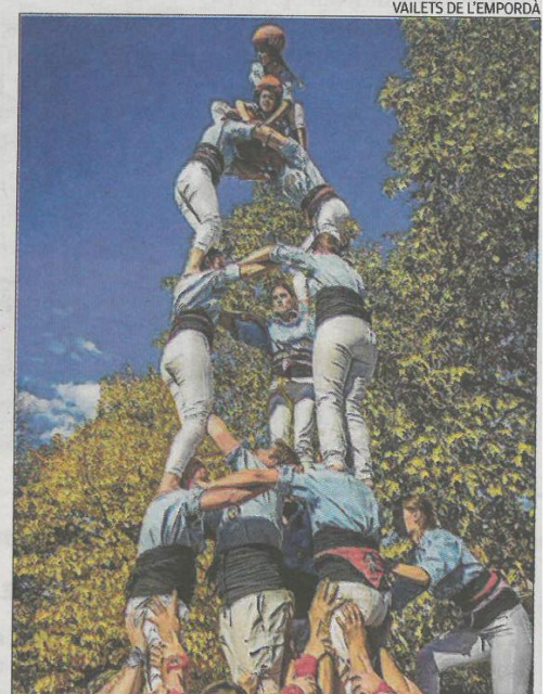
El 3 de 6 aixecat a Cerdanyola diumenge passat.

D'altra banda, Els Vailets encara tenen prevista una darrera sortida, els dies 15 i 16 de desembre quan aniran a Sarlat la Canéda, un poble francès, on actuaran en el Mercat de Nadal local.