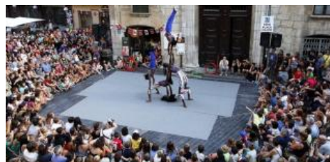
Els kenyans Afro Jungle Jeegs, durant el seu espectacle frenètic d'acrobàcies i equilibris a la plaça Major.