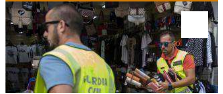
Operació de la Guàrdia Civil contra les falsificacions a Lloret de Mar