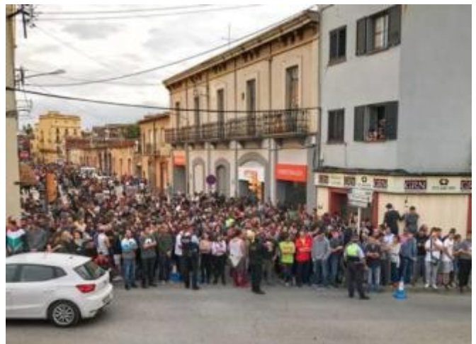
L'espai més votat. aj. de la Bisbal

El tram del carrer Coll i Vehí on hi ha les Escoles Velles passarà a dir-se carrer 1 d'Octubre, després que aquest hagi estat l'espai més votat pels veïns en el procés participatiu iniciat el 9 de juliol i que va finalitzar aquest diumenge passat. Segons va informar ahir el consistori, 158 persones van votar aquest espai on s'hi troben les Escoles Velles i on el passat 1 d'octubre una multitud es va concentrar davant de l'equipament municipal, tot defensant el dret a vot a la consulta sobre la independència de Catalunya.