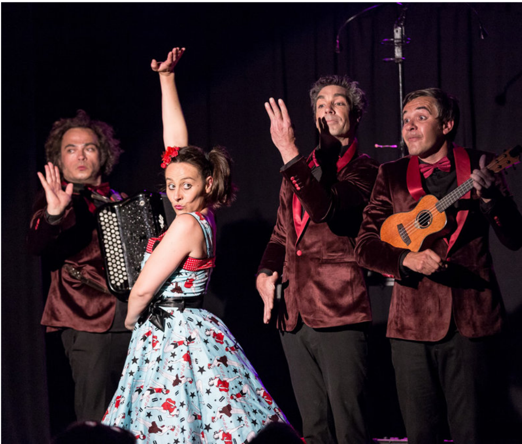
Els quatre actors de "Menjar", en una de les escenes de l'obra de teatre