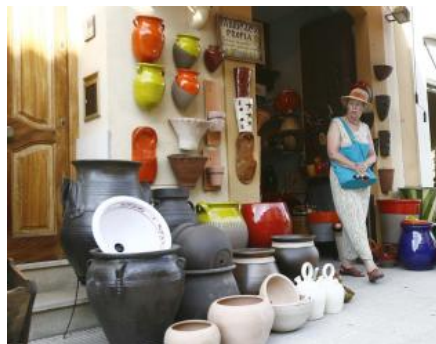
La Bisbal: la capital eterna de la ceràmica Aniol Resclosa

Una de les imatges que ens va deixar el turisme dels anys seixanta és la dels estiuejants passejant pel popular carrer de l'Aigüeta de la Bisbal d'Empordà. Persones vingudes d'arreu, sovint escapant-se d'un dia rúfol a la costa, armades amb gelats de tots els gustos i untades d'AfterSun, se les veia rondar entre peces de ceràmica i souvenirs. Encara avui, i salvant les distàncies d'èpoques daurades, deixar-se perdre per les botigues de ceràmica, o pels cada cop més nombrosos brocanters instal·lats a la ciutat, és una mena de litúrgia que els passavolants segueixen fent. Una situació que a més d'un lector li resultarà familiar.