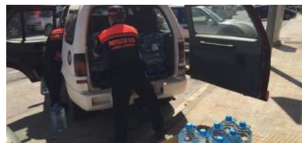
Repartiment d'aigua a domicili Protecció Civil de la Bisbal d'Empordà